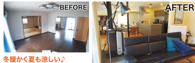
冬暖かく夏も涼しい!